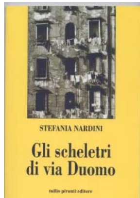
Gli scheletri di via Duomo